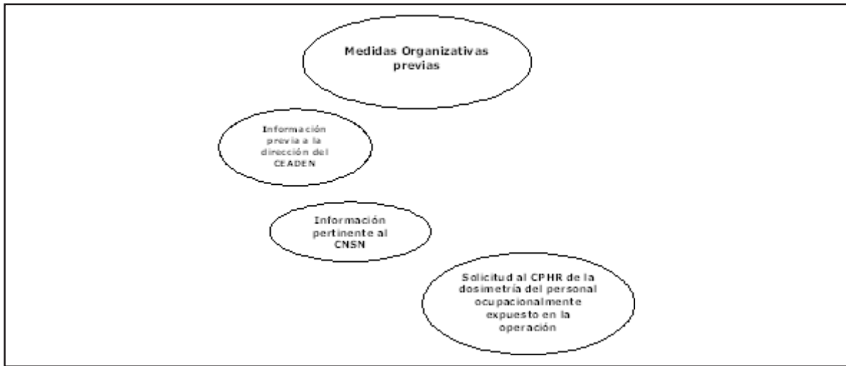
Figura 1. Esquema de notificación a las entidades involucradas en el proceso de desmantelamiento (CPHR-CNSN).